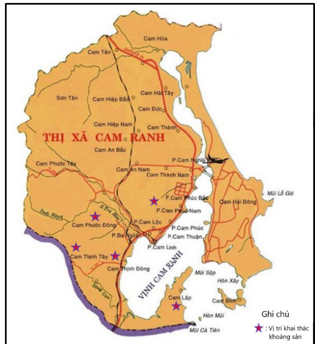
H.1. Bản đồ vị trí khu vực khai thác khoáng sản tại thành phố Cam Ranh

Ngoài những loại khoáng sản nêu trên, tại xã Cam Thịnh Tây mới phát hiện thêm loại khoáng sản có giá trị là đá thạch anh, tuy nhiên hiện chưa có đánh giá về trữ lượng và chất lượng loại đá này nên chưa có hoạt động khai thác tại đây. Vị trí các điểm phân bố khoáng sản được trình bày trên Hình H.1.